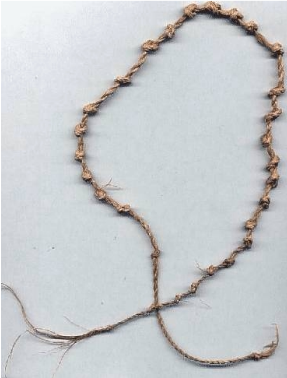
Wekui. Procedente de la comunidad Wonken, Gran Sabana. Mide 52 cm. de longitud y cuenta 29 nudos de diferentes tamaños.